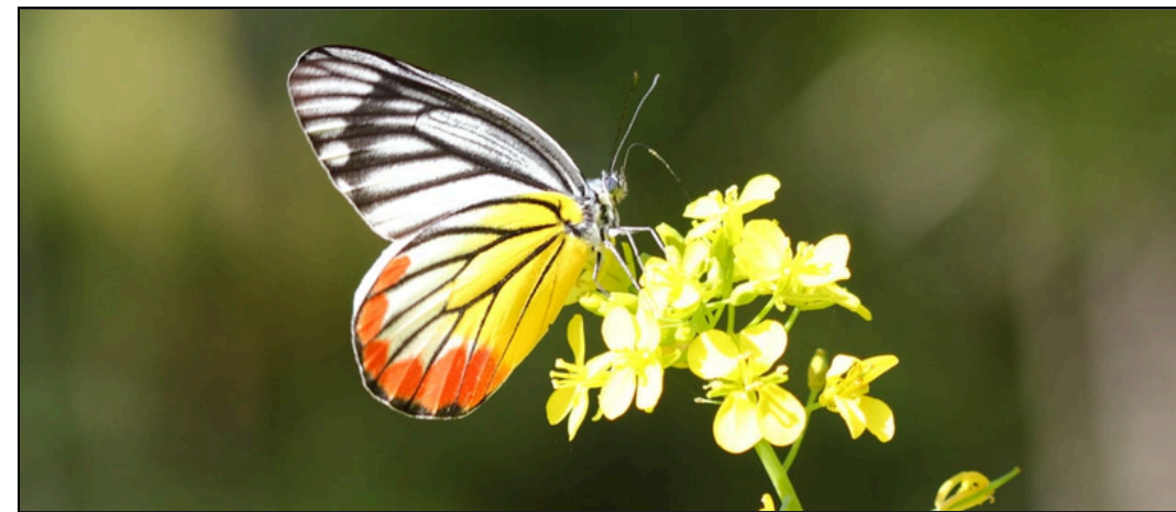
সময় হ'লেই ফুলি উঠে ফুল, পাখি মেলি উৰি আহে আশাৰ পখিলা...

কৰিছো সাম্প্ৰতিক সাংবাদিকতাৰ যিটো কণ্টকাকীৰ্ণ পথ, সেই বাটেৰে ৪ নং পৃষ্ঠাত